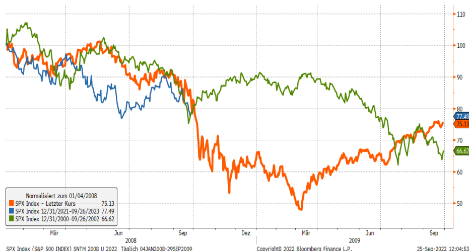
S&P 500 Index im Verlaufsvergleich: 2001, 2008 und 2022

Im Wochenverlauf ist aus der hohen Angst ein Anflug von Panik geworden. Zeitweise fielen die Kurse deutlich. Die Stimmung ist weiter sehr schwach. Damit ist der Markt nun an einer interessanten Weggabelung angekommen: folgen wir weiter dem 2008er-Pfad, der sich bislang auch mit 2001 relativ gut deckte. Oder wechselt der Markt die „Fahrspur“ und folgt nun dem 2001er-Pfad? Der Unterschied zwischen 2001 und 2008 könnten ab jetzt kaum größer sein.